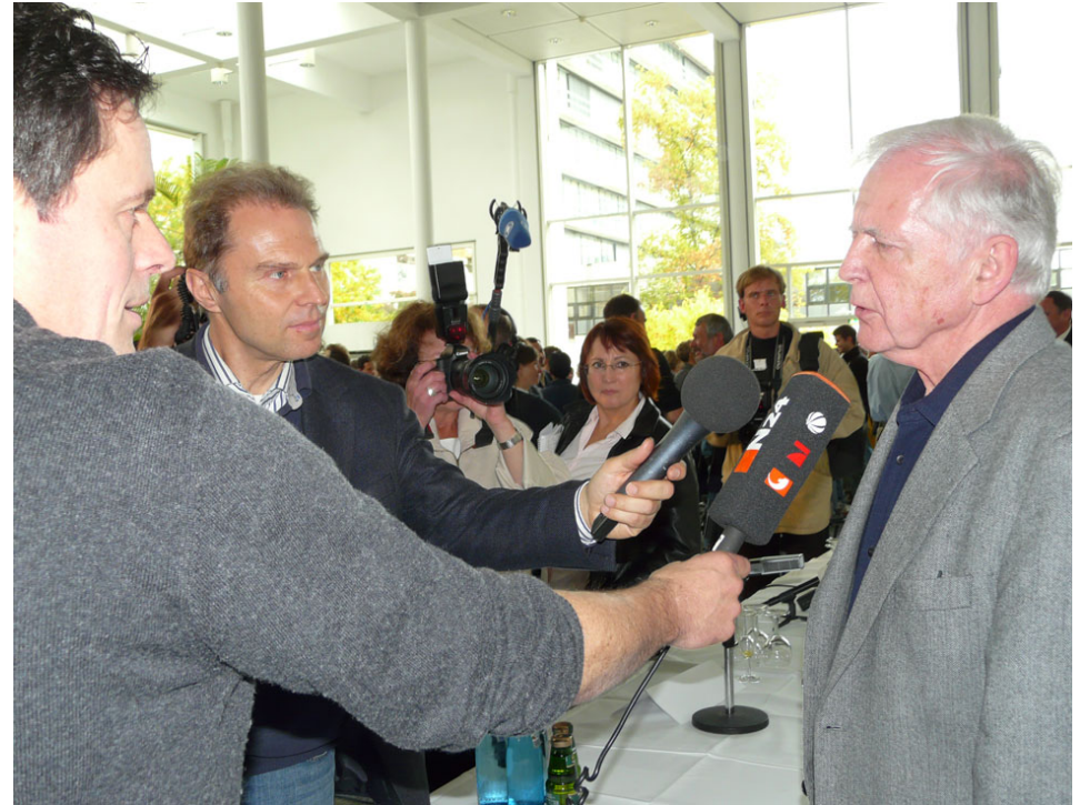
Pressekonferenz 6. Oktober, DKFZ, Heidelberg