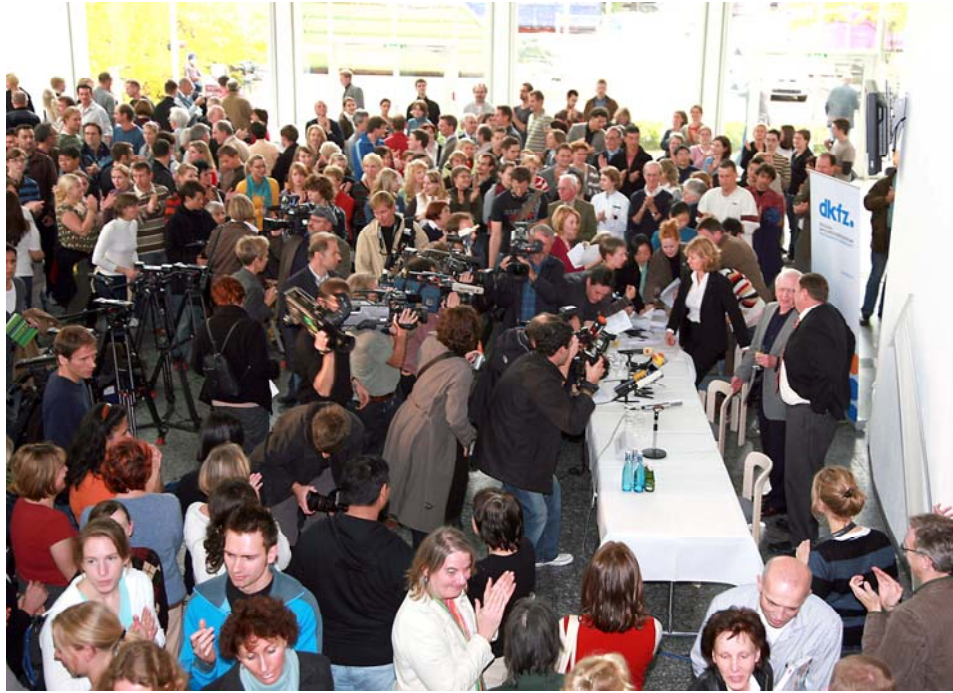
Pressekonferenz 6. Oktober, DKFZ, Heidelberg