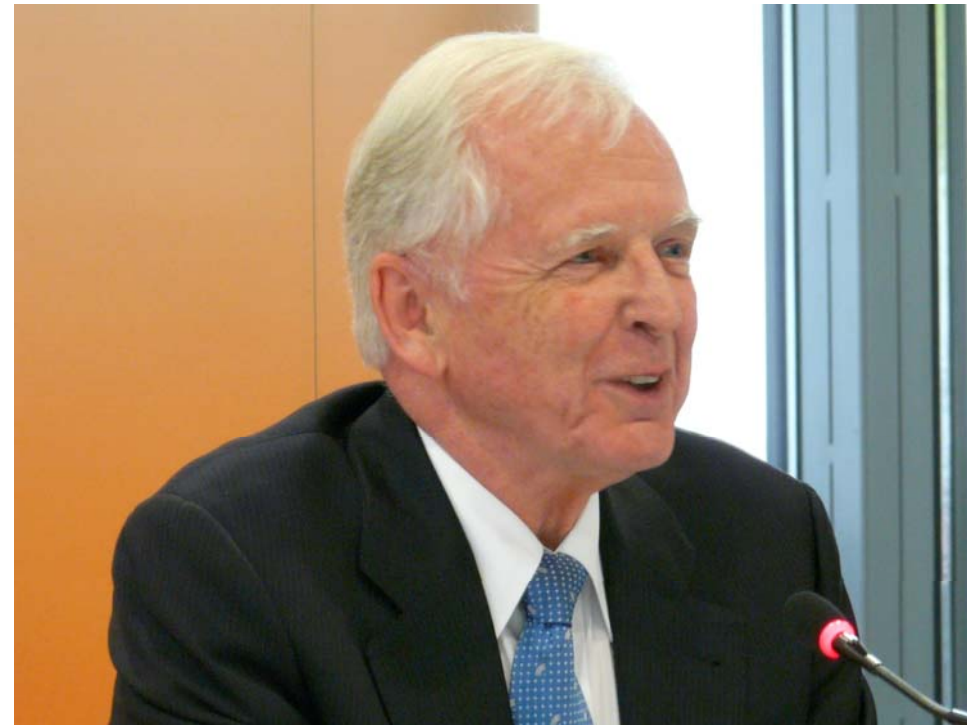
Prof. Harald zur Hausen, Pressekonferenz 9.Oktober 2008, Berlin