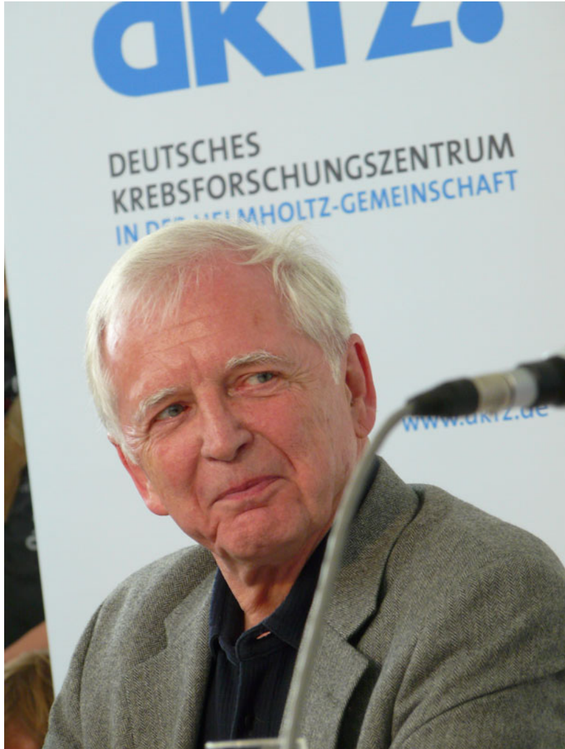
Prof. Harald zur Hausen, Pressekonferenz 6. Oktober, DKFZ, Heidelberg