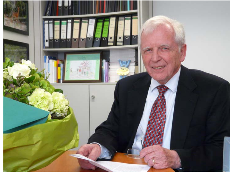
Prof. Harald zur Hausen