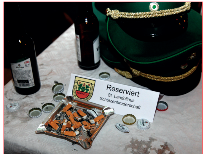
Abb. 3: Fotodokument der Vorstudie. Rauchreglement auf einem Schützenfest im Raum Paderborn.

Die Messungen auf den Schützenfesten sowie die Vorstudie mit der fotografischen Dokumentation (Abb. 3) erfolgten Mitte August bis Mitte September 2012. In allen Festzelten waren die Eingangstür sowie die Fenster oder die Seiteneingänge während der Veranstaltung permanent geöffnet, in einem Fall waren darüber hinaus mehrere Ventilatoren in Betrieb. Es ist anzunehmen, dass die Schadstoffbelastung durch Tabakrauch bei schlechteren