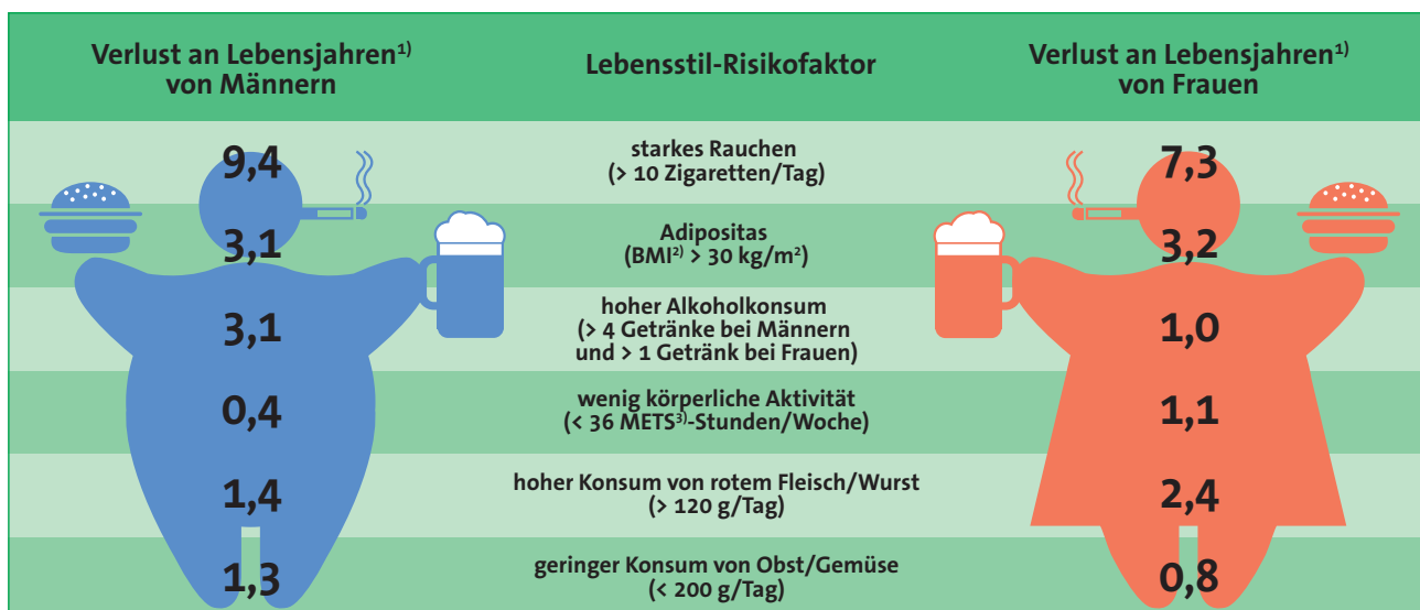
Abbildung 1: Lebenszeitverlust von über 40-Jährigen aufgrund verschiedener Lebensstil-Risikofaktoren. 1) Im Vergleich zum Niemals-Rauchen, einem optimalen BMI, keinem oder nur geringem Alkoholkonsum sowie geringem Konsum von rotem Fleisch und Wurst; 2) BMI = Body Mass Index (Richtwert zur Beurteilung des Körpergewichts in Bezug zur Körpergröße); 3) METS = metabolische Äquivalente (erlauben unter Berücksichtigung der Dauer und Intensität der Tätigkeit einen Rückschluss auf den Sauerstoff- bzw. Energieverbrauch im Vergleich zu einer ruhenden Tätigkeit). Darstellung: Deutsches Krebsforschungszentrum, Stabsstelle Krebsprävention, 2014

Das Leben verkürzen vor allem Rauchen, Übergewicht sowie hoher Konsum von rotem Fleisch und Wurst, wobei sich das Rauchen mit Abstand am deutlichsten auf die verbleibende Lebenszeit auswirkt (Abb. 1). Ein niedriger Verzehr von Obst und Gemüse sowie eine geringe körperliche Aktivität zeigten bei der Studie im Vergleich hingegen nur eine geringfügige Wirkung. So verlieren Männer durch starkes Rauchen (mehr als zehn Zigaretten pro Tag) durchschnittlich 9,4 Lebensjahre,